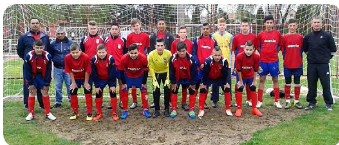
Dobogós helyért játszó serdülő csapatunk