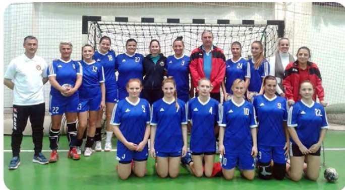
Hajdúszoboszlóról is értékes pontokat hoztak el

A 2016/17. évi bajnokság alapszakaszának végén a felnőtt női kézilabdázóink a dobogó második fokára léphettek fel