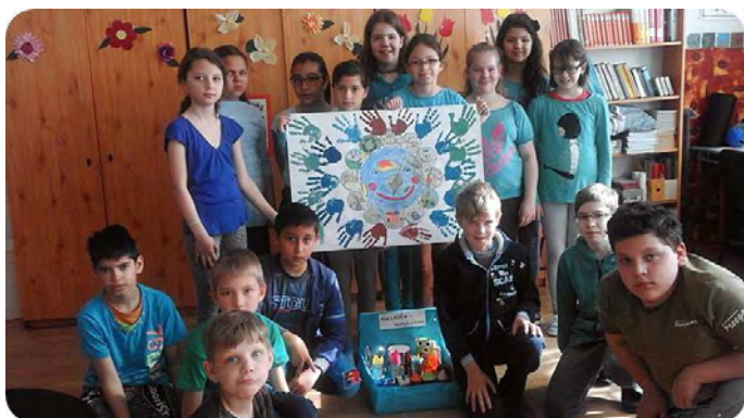
4. a osztály

Április 27-én délután csatlakoztunk azon országos kezdeményezéshez, melyet Bagdi Bella indított el. 23 ország több mint 150000 gyermeke énekelte együtt a „Gyűjts egy gyertyát a Földért!” dalt, aminek Mi is részesei lehettünk, mind a közel 260 alsós tanuló és pedagógusaink. Erre a napra minden osztály különböző technikával rajzokat készített, amelyből kiállítást rendeztünk.