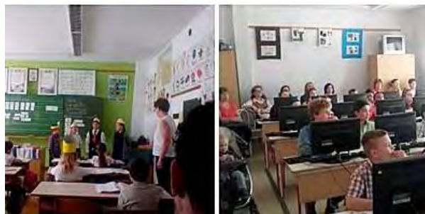
Anyák napja – nyílt órák