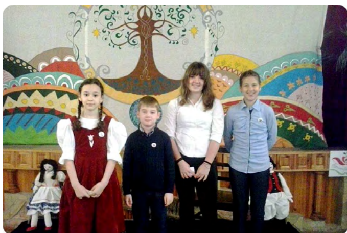
Irinys mesemondók Konyáron

14. alkalommal rendezték meg április 19-én, Konyáron az „Égig érő fa” járási mesemondó versenyt . 15 iskola gyermekei varázsolták el a jelenlévőket a mesék birodalmába. Intézményünket a helyi versenyen legeredményesebbnek bizonyult diákok képviselték.