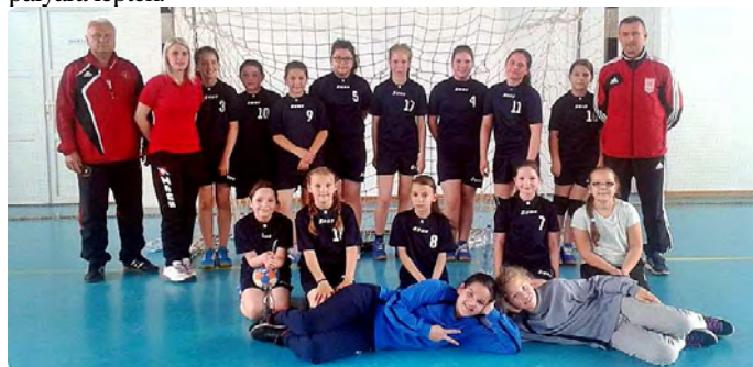
U 11-es csapatunk

Az U-11. korosztályos csapat is befejezte a régiós bajnoki évadot. A záró mérkőzésre hazai környezetben került sor. A tornán Létavértes mellett Debrecen, Mátészalka és Nyíradony csapatai is pályára léptek.